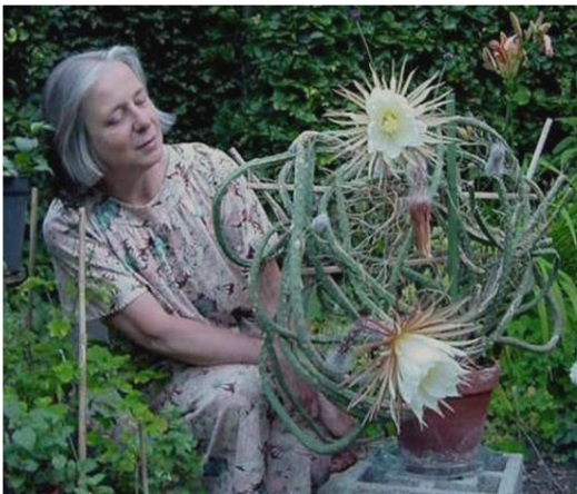
Selenicereus grandiflorus - Cactus grandiflorus

Systematik ⇒ Kerneudikotyledonen CORE EUDICOTS : Ordnung: Nelkenartige ( Caryophyllales ); Familie: Nelkengewächse; Unterfamilie: Cactoideae; Tribus: Hylocereeae; Gattung: Selenicereus; Art: Selenicereus grandiflorus; Wissenschaftlicher Name: Selenicereus grandiflorus oder Cactus grandiflorus Homöopathisch Vergleichbar mit der Eisenserie!