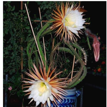
»Königin der Nacht« mit Blüten