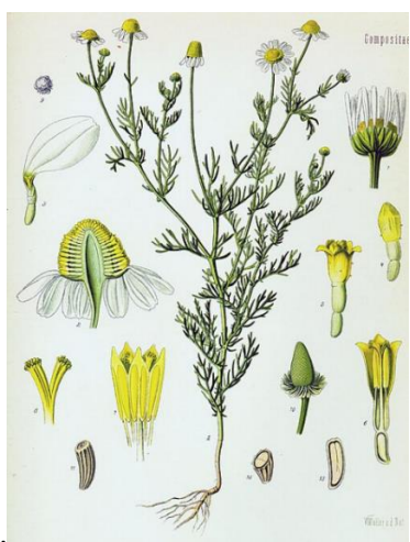
Illustration aus Köhler's Medizinal-Pflanzen