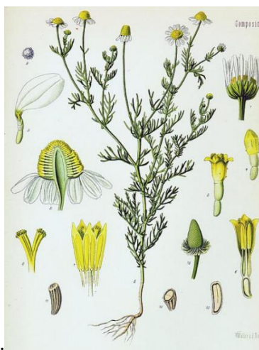
Illustration aus Köhler's Medizinal-Pflanzen