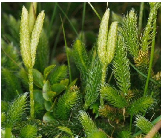
Lycopodium im Habitat