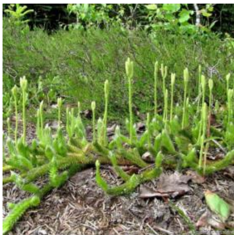
Keulen-Bärlapp ( Lycopodium clavatum )

Der Keulenbärlapp Lycopodium clavatum , gehört systematisch zu den Farngewächsen , die im Wesentlichen in die drei Klassen Bärlappgewächse (Lycopodiaceae), Schachtelhalme (Equisetopsida) und die eigentlichen Farne (Polypodiopsida) eingeteilt werden. Die Klasse der Bärlappe entstand im Karbon einer Zeit vor 360 bis 400 Millionen Jahren, sie bildeten die heute ausgestorbenen Schuppen- und Siegelbäume. Die heutige Gestalt der Lycopodium-Arten sind etwa seit 300 Millionen Jahren unverändert erhalten. Farne sind auf allen Fünf Kontinenten der Erde vertreten. Es gibt weltweit rund 12.000 Arten, die meisten davon leben in den immerfeuchten Tropen. In ganz Europa sind etwa 171 Arten, in Mitteleuropa etwa 101 Arten beheimatet.